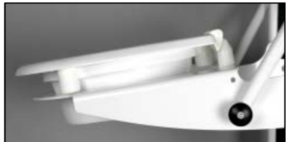
Coxit 9° eller 60 mm lutning Sittplåten lutande, bakre fästen 30 mm

Montera fast den nya sitsen enligt som någon av alternativen