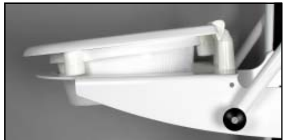
Coxit 4° eller 30 mm lutning Sittplåten plan, bakre fästen 55 mm