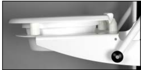
65 mm förhöjd fram och bak Sittplåten plan, bakre fästen 30 mm

2 st gängstänger med plastmutter, används om sitsen skall monteras på toaletten utan lift.