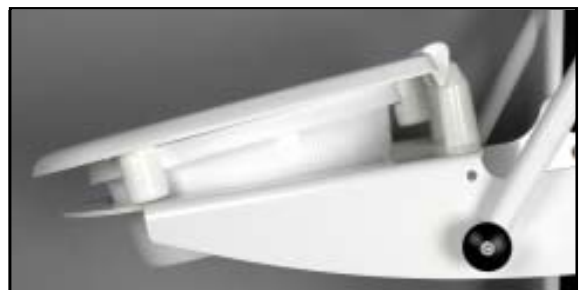
Coxit 13° eller 90 mm lutning Sittplåten lutande, bakre fästen 55 mm