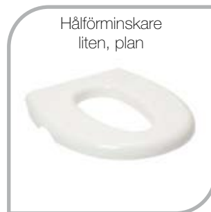
Hålförminskare liten, plan