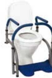
Modell 5 , art. nr. 10 105