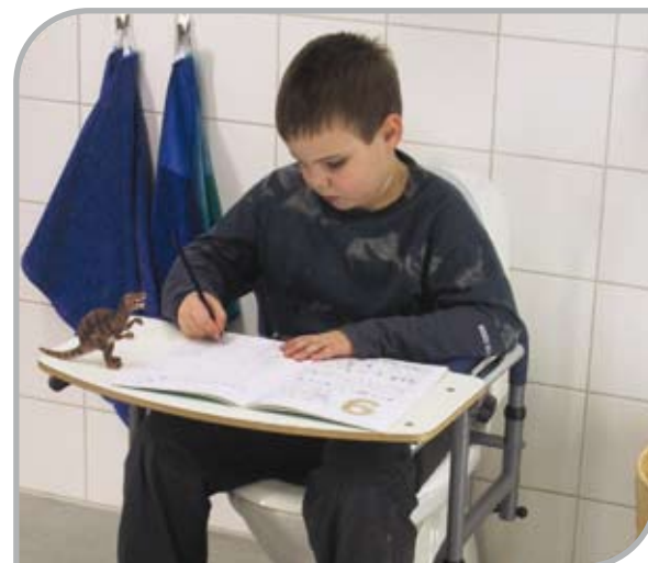
Balance med tillbehöret bordsskiva