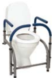
Modell 3 , art. nr. 10 103