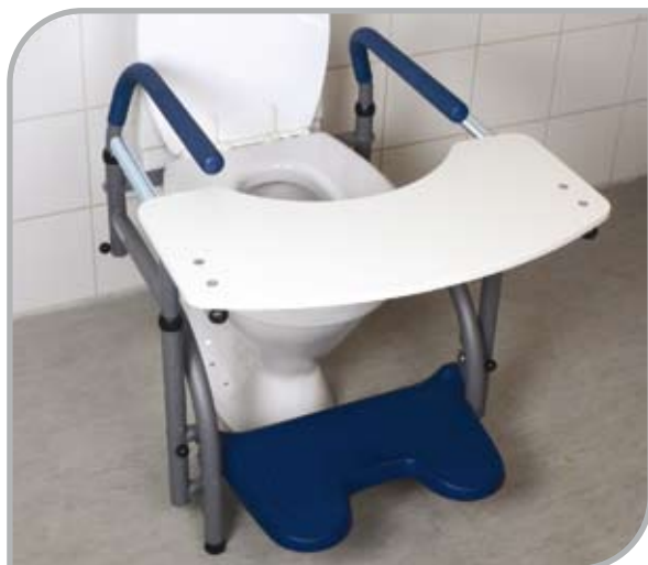
Balance med tillbehöret bordsskiva

Med minipallen placerad på fotpallen, får även de minsta barnen ett bra fotstöd.