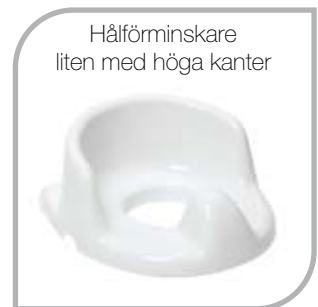
Hålförminskare liten med höga kanter