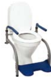
Modell 9 , art. nr. 10 109