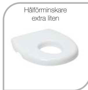
Hålförminskare extra liten