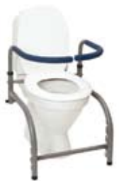
Modell 8 , art. nr. 10 108