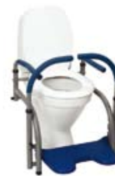
Modell 10 , art. nr. 10 110