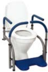
Modell 2 , art. nr. 10 102