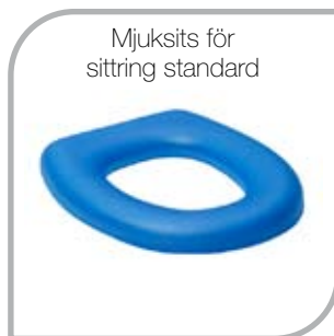
Mjüksits för sittring standard

Art. nr. 10 035, H. 250 mm B. 360 mm D. 100 mm