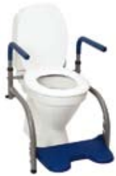
Modell 1 , art. nr. 10 101