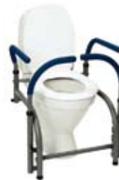
Modell 6 , art. nr. 10 106