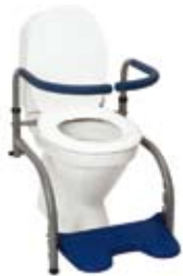
Modell 7 , art. nr. 10 107