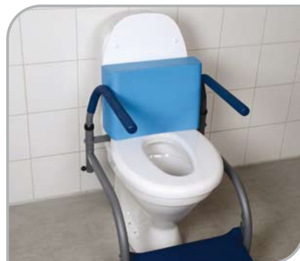
Balance med tillbehöret ryggkudde och hålförminskare