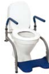
Modell 4 , art. nr. 10 104