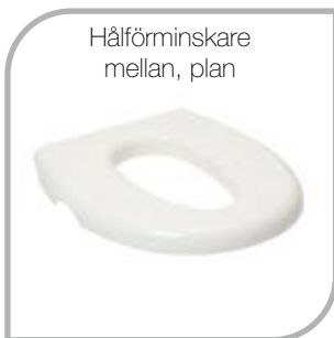
Hålförminskare mellan, plan